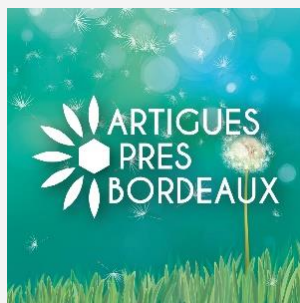
TABLEAU DES DÉCISIONS DU MAIRE